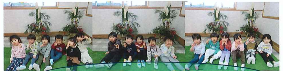
すてきな門松と撮りました☆三