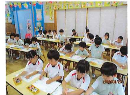
夏の思い出を絵にしたよ!★