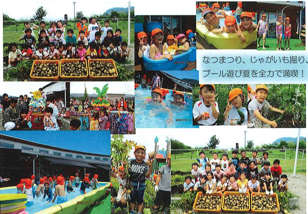
なつまつり、じゃがいも掘り、プール遊び夏を全力で満喫！

休み明け間もなく、収穫したジャガイモを使ってカレー作りを行う予定です。ご家庭でも野菜を洗ったり、ピーラーで皮をむいたりお手伝いをする機会を作ってください。